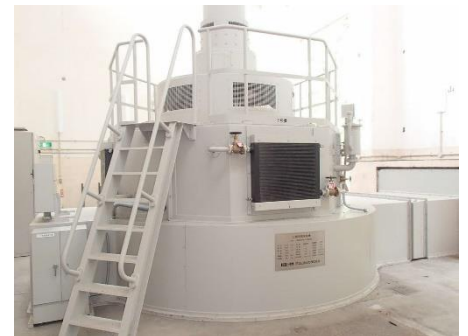
八戸川第一発電所 1号機内部