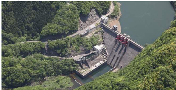
八戸川第二発電所